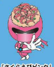
「さくらえびピンク」